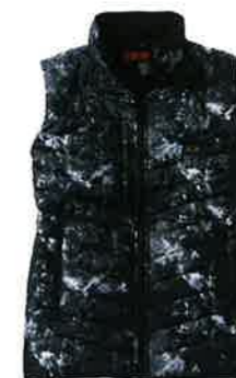
ブラックカモフラ (C/142)