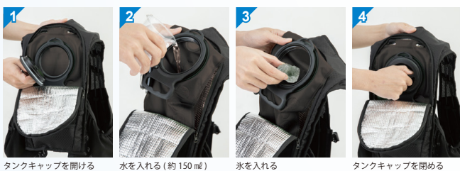
タンクキャップを開ける